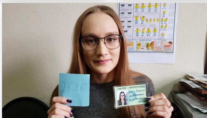
Рисунок 1 пример фотографий